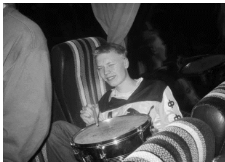
”Humppaa, taikka maalaa”