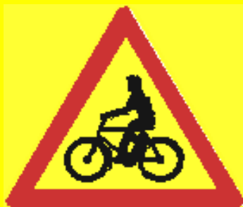
Varo pyöräileviä valmentajia