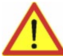
Varo FCLK:n huutoja

25/5 Tampereelle TamUa vastaan. Tamme- lassa tuntee olevansa kuin kotona, katsomot vähän rähjäiset, mutta katsojia nytkin yli