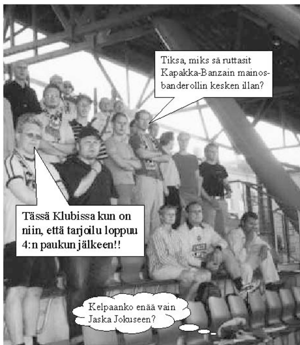
Kuva: Jarkki, teksti: JJH

- Mitä on ryhmäseksi savoksi? - Mulukkutalakoot.